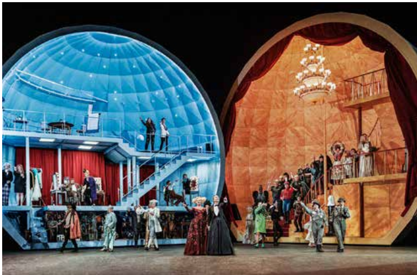
Den glade enke 2.0 for fuld skrue.

Ironien og sarkasmen er med andre ord tommytk. Og det virker. Der skal nok sidde denne og hin i salen og længes efter de store pragtrober og det parisiske overklasse miljøes glimtende opulence i historien