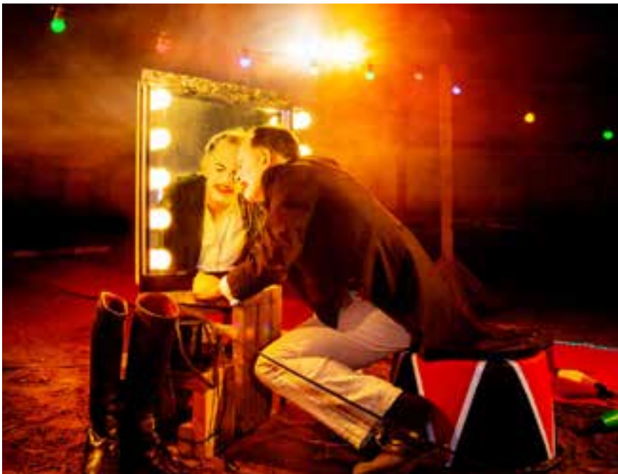
Fra Søholm Operas Pagliacci