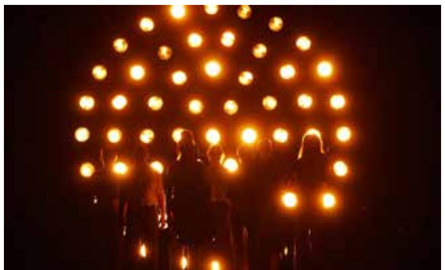
Opraen Nordkraft , produceret af Copenhagen Opera Festival

Copenhagen Opera Festivals program kan ses på www.operafestival.dk . ■