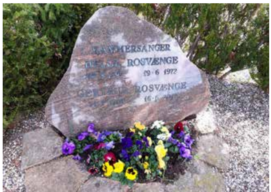
Rosvænges gravsted i Glostrup.

danske sanger og dels for et aktuelt foto af gravstedet. Vil man besøge stedet er adressen Glostrup Nordre Kirkegård, Gammel Landevej 1. Drej straks til venstre og parkér efter ca. 80 meter på græsarealet ved Afdeling 3A. Gå ind her; drej straks efter grønt træaffaldsstativ til højre. I 2. række til venstre findes Helge Rosvænges smukke gravsted (nr. 59, under to høje træer). ■