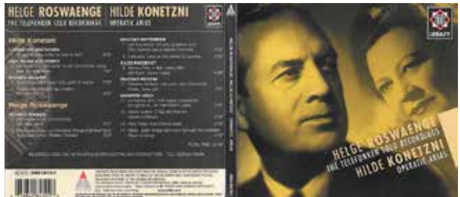
Cover til albummet med Helge Rosvænge og Hilde Konetzni.

Flere læsere har glædet sig over de to artikler om Helge Rosvænge i sidste udgave af Ascolta og vi skal på givnen foranledning tilføje, at vi fejlagtigt fik placeret