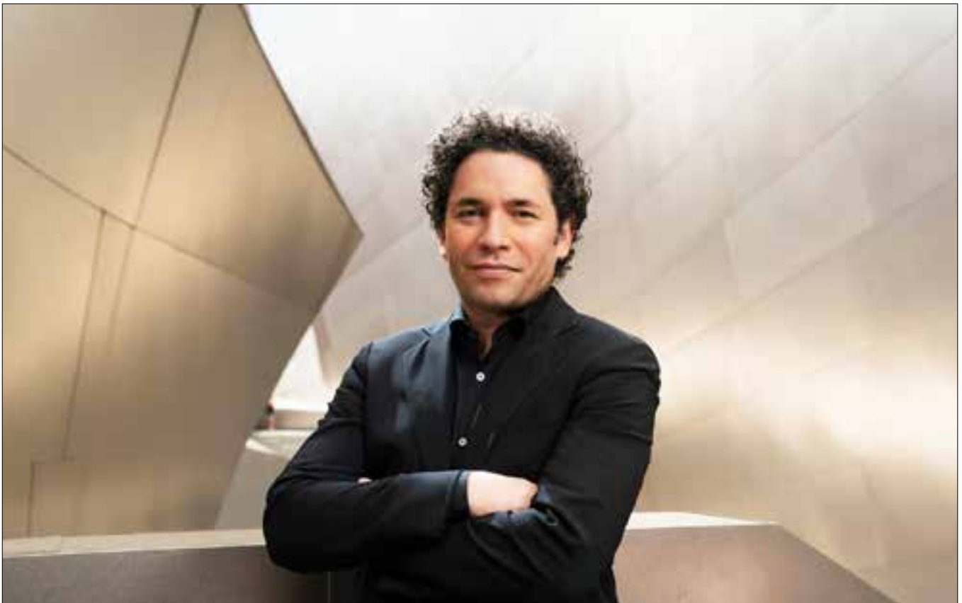
40-årige Dudamel afløser Philippe Jordan i Paris.