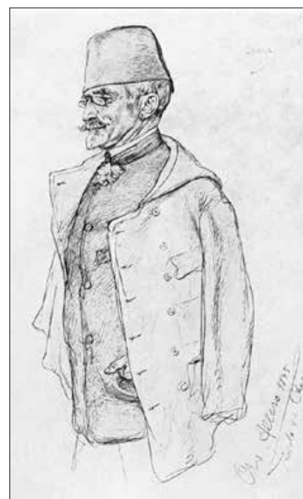
Camille du Locle

Men du Locle gav ikke op, og i april 1870 fik han uventet hjælp i form af en henvendelse fra egyptologen Auguste Mariette. Mariette var en af sin tids mest fremtrædende arkæologer, men hans karrierevej havde ikke