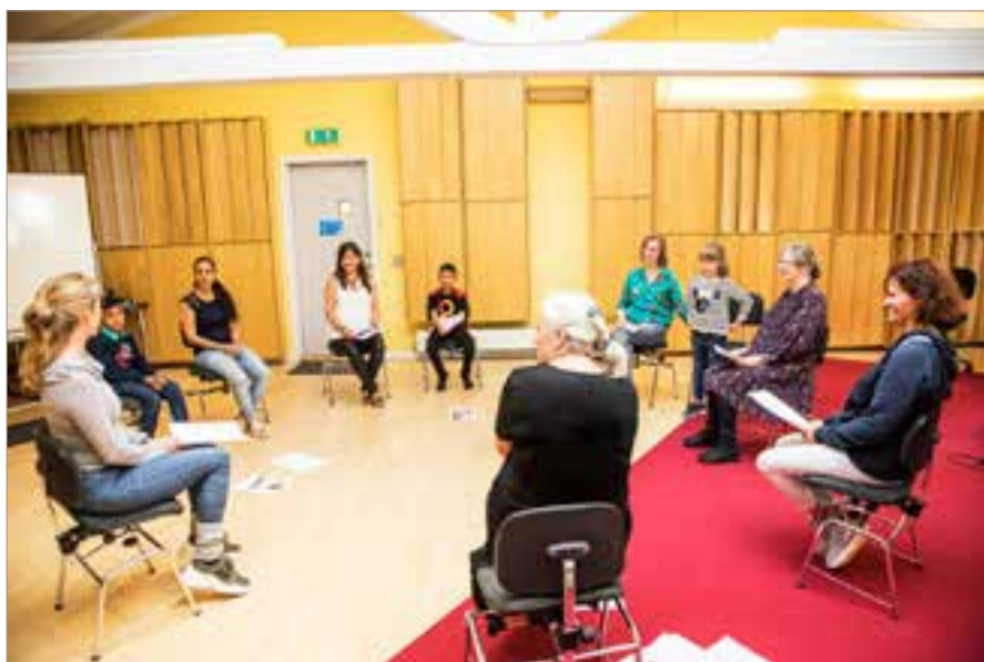
Sanggruppemøde omkring projektet "En tone i livet" på DJO