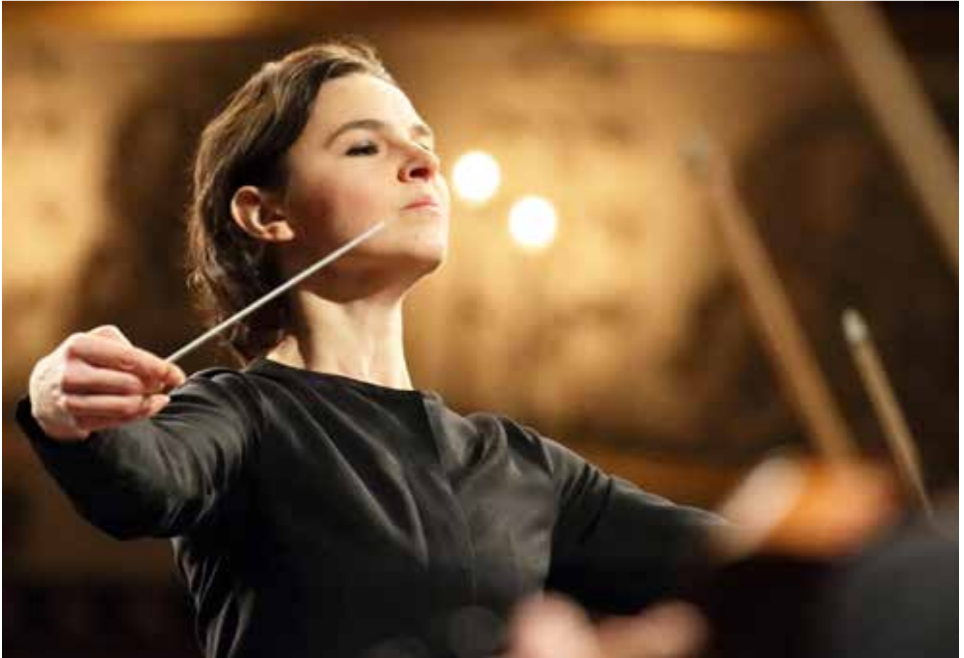
Oksana Lyniv, første kvindelige dirigent på podiet i Bayreuth

ske baryton husker vi for pragtpræstationer på Det Kongelige Teater - som en iskold Jago i Verdis Otello og som en gedigen ondsksfuld Scarpia i Puccinis Tosca .