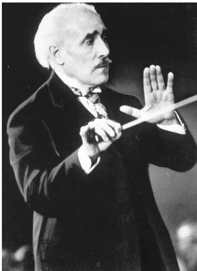
Arturo Toscanini (1867-1957)

sine forbehold, for han vil kun ægte prinsessen, hvis det sker af ægte kærlighed. Han giver hende derfor den chance, at kan hun gætte hans navn og herkomst inden daggry, skal hun gå fri. Det lykkes hende at få de oplysninger, hun har