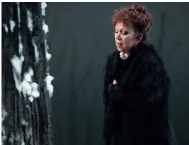
Mirella Freni i sin glansrolle som Mimi i La Bohème

De to, Freni og Pavarotti, stammede begge fra Modena og havde et livslangt venskab. Den italienske sopran, der også vil blive husket for sin fortolkning af Desdemona i Verdis Otello , var Herbert von Karajans yndlingsangerinde, hvilket gav sig udslag i en række opførelser fra det italienske operarepertoire. Hendes hjemmebane var naturligvis La Scala i Milano. Hun trak sig tilbage i 2005. ■